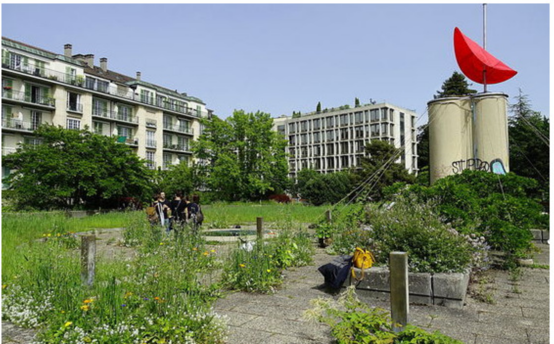
Ein paar Pflanzen lassen die Betonterrasse Bellefontaine förmlich erblühen.

An der Placette du peuplier haben sich Wurzeln den Weg nach oben gebahnt und den Asphalt aufgeworfen. Uppiges Grün belebt diesen normalerweise eher grau wirkenden Platz mit der grossen Pappel und einer Statue der Aurora, der römischen Göttin der Morgenröte. Doch es scheint nur so als hätten die Pflanzen die Oberhand über den Beton gewonnen. Tatsächlich wurde die kleine Oase von Menschenhand geschaffen – für die Ausstellung „Lausanne Jardins.“