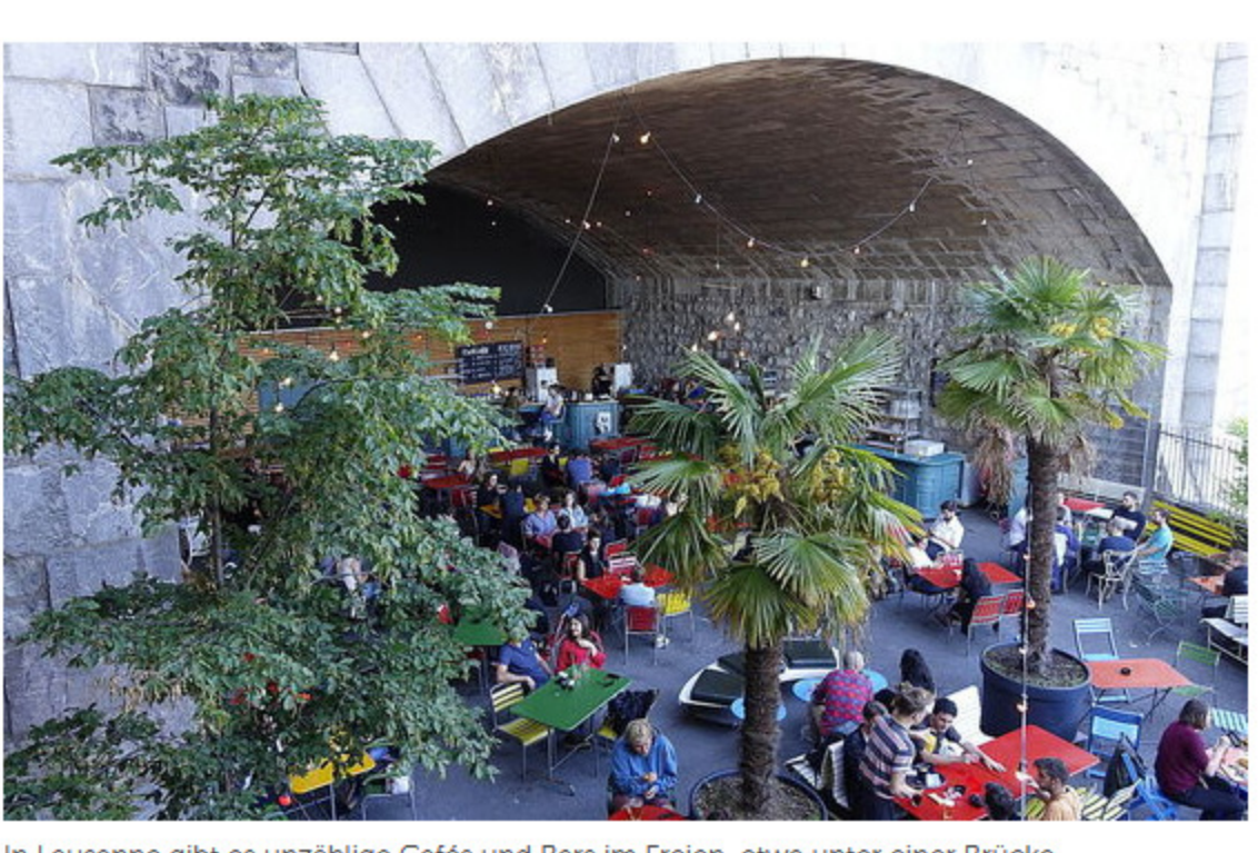
In Lausanne gibt es unzählige Cafés und Bars im Freien, etwa unter einer Brücke.

Lausanne Jardins ist ein wunderbarer Grund, einen Spätsommerausflug an den Genfersee zu machen. Mit insgesamt 350 Hektaren Grünfläche und 100 Parks gehört Lausanne übrigens zu den grünsten Städten weltweit. Es muss nicht nur beim Sehen bleiben. Um die Ausstellung herum gibt es eine Fülle an Veranstaltungen – von der Lesung bis zum Workshop. Zum Anlass wurde eigens ein ausführliches Roadbook erstellt, anhand dessen man von Grünplatz zu Grünplatz schlendern kann. Dabei entdeckt man auch die zahlreichen einladenden Bars und Restaurants im Freien, zum Beispiel unter einem Brückenbogen. Schön klingt so ein Ausflug auf dem Balkon der beliebten Brasserie de Montbenon im gleichnamigen Park aus. Oder man sitzt in der Altstadt draussen vor der Institution Café du Grütli und gönnt sich Schweizer Spezialitäten. Eigentlich aber ist ein Tag für einen ebenso lehrreichen wie genussvollen Abstecher in die Waadtländer Kantonshauptstadt zu kurz, denn es lockt ja noch der See. Und da wäre auch das ausserordentlich spannende Olympische Museum, ein Muss für alle Sportfans – das immer einen Besuch lohnt, auch im Sommer.